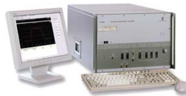
自動試験システム (HERMON TCA 8200)